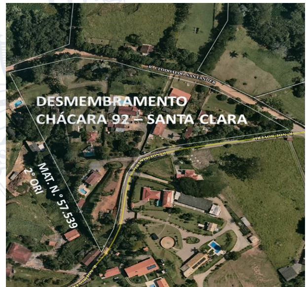
Imagem 1 – Imagem de Satélite do Desmembramento Chácara Agrícola nº 92 Sítio Santa Clara