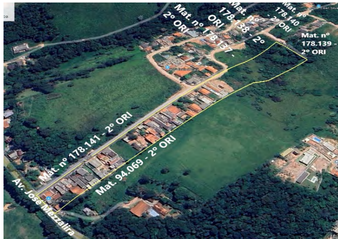
Imagem 1 – Imagem de Satélite do Loteamento "Estancia Bianchini I".