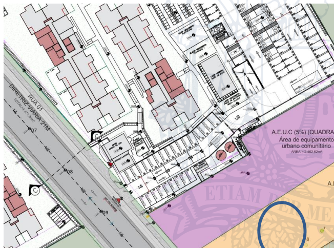
Imagem 2: Acesso condomínio 3

O RIT apresenta o cronograma de implantação do empreendimento, estimado em trinta e seis meses a partir de junho de 2.025, ou seja, sua conclusão e ocupação deve se dar em meados do ano de 2.028.