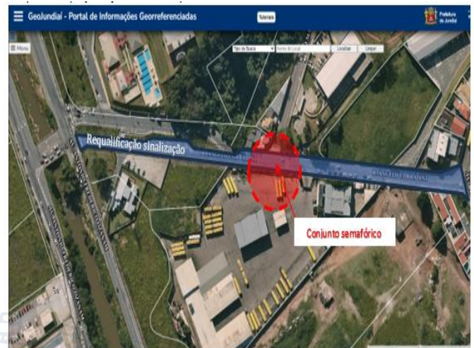
Imagem 3: Croqui de localização da intervenção

e requalificação da sinalização viária defronte a testada do empreendimento, conforme destaque na imagem a seguir, mediante aprovação prévia dos respectivos projetos junto à municipalidade.