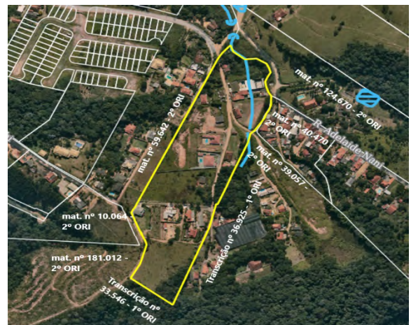
Imagem 1 – Imagem de Satélite da área do Loteamento Jardim Olívia