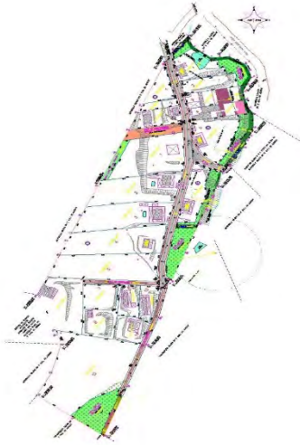
Imagem 2 – Imagem do Projeto Urbanístico do Loteamento Jardim Olívia

Notifica com base no art. 31º §1º da Lei Federal nº 13.465/2017, de 17 de julho de 2017, e seu Decreto regulamentador nº 9.310/18, de 15 de março de 2018, os proprietários, abaixo indicados, a apresentarem impugnação dentro do prazo de 30 (trinta) dias contados da data de publicação do presente edital na Imprensa Oficial do Município.