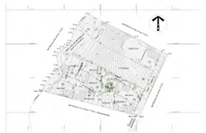
Imagem 2 – Imagem do Projeto Urbanístico do Loteamento "Chácara Boa Vista".

Notifica com base no art. 31º, §1º da Lei Federal nº 13.465/2017, de