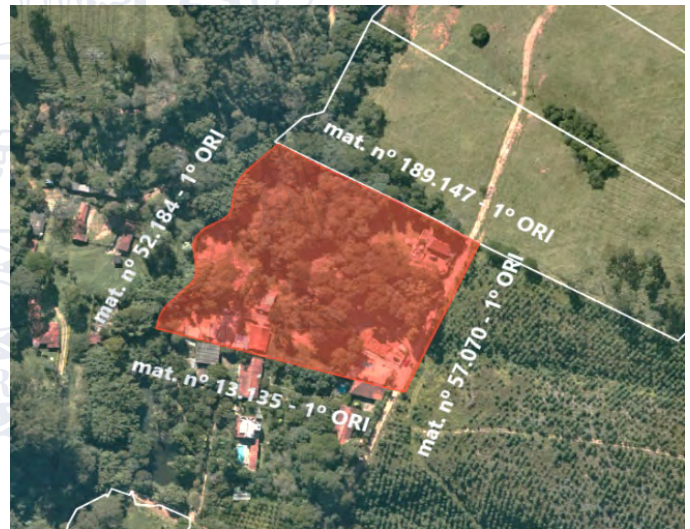
Imagem 1 – Imagem de Satélite do Loteamento "Chácara Boa Vista".