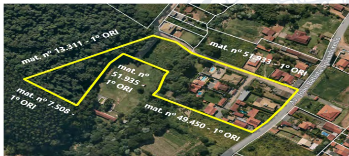
Imagem 1 – Imagem de Satélite do Loteamento “Santa Rosa II”.