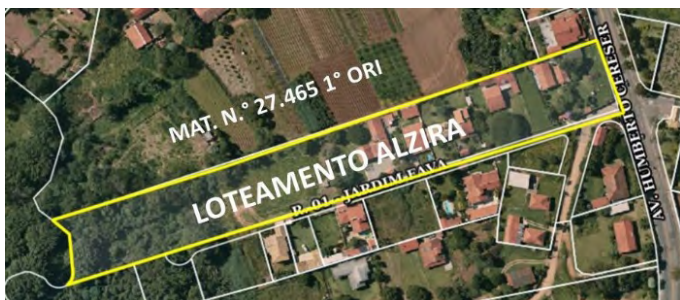
Imagem 1 – Imagem de Satélite do Loteamento "Alzira".