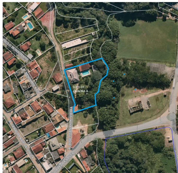
Imagem de Satélite do Lote 03 – quadra A – Loteamento Parque Corrupira Etapa 1

As impugnações cabíveis, contrárias ou adversas ao objeto deste ato, deverão ser apresentadas no prazo de (30) trinta dias, a contar da data do recebimento, sendo que as impugnações poderão ser protocoladas no Departamento de Regularização Fundiária da Secretaria Municipal de Habitação Social da Prefeitura do Município de Jundiaí – Avenida União dos Ferroviários, 2.222 – Centro e através dos endereços eletrônicos: asciamarelli@jundiai.sp.gov.br e/ou troliveira@jundiai.sp.gov.br , com as devidas justificativas plausíveis que serão analisadas pelo Departamento. Não havendo manifestação em contrário no período de 30 dias, considerar-se-á como aceite os elementos desta notificação, conforme prevê a Lei Federal nº 13.465/2017, artigo 31º, §1º e §4º, e transcorrido o prazo legal para manifestações, será efetivado o ato, na forma do artigo 31º, §5º e §6º da Lei Federal 13.465/2017.